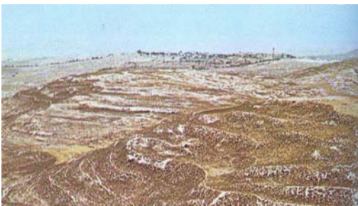
مسقط رأس ارميا، عناثوث

٨- إذا كان حلقيا هذا الذي كان رئيساً للكهنة هو نفسه المذكور في (ارميا ١: ١) فإن القاموس، لا بدّ، يذكر ذلك مبيّناً هذا الشاهد (ارميا ١: ١). هذا يعني أن أبا ارميا _____ رئيساً للكهنة.