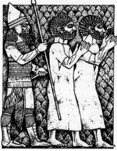
رجلان إسرائيليان مسبيان

ما هو التعليق الوارد في هذا الإصحاح الذي يثبت أن ارميا كان راضياً عن حكم الملك يوشيا؟